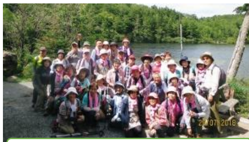
「みんなで集合写真」