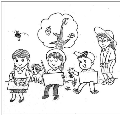
絵や線の濃淡は含みません

クイズの答えといっしょにいただいたお便りは「声」欄で紹介させていただきますことがあります。ご了承ください。