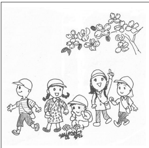
絵や線の濃淡は含みません

ーニュースの封筒詰めにご協力下さい。5月号の封筒詰め作業日は5月26日(月)の午前中です。広報委員会